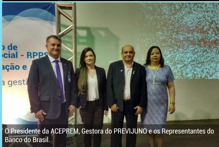
O Presidente da ACEPREM, Gestora do PREVIJUNO e os Representantes do Banco do Brasil.