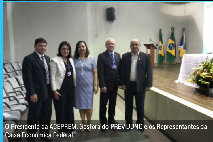
O Presidente da ACEPREM, Gestora do PREVIJUNO e os Representantes da Caixa Econômica Federal.