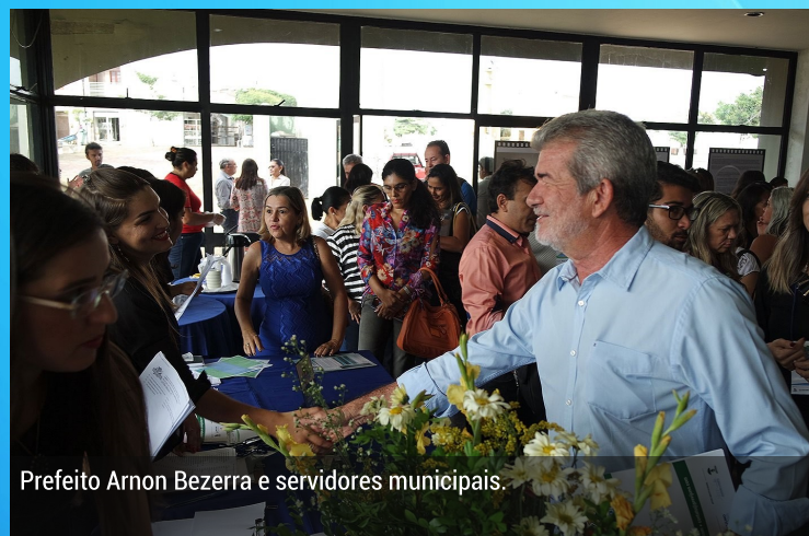
Prefeito Arnon Bezerra e servidores municipais.