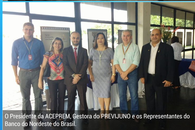
O Presidente da ACEPREM, Gestora do PREVIJUNO e os Representantes do Banco do Nordeste do Brasil.