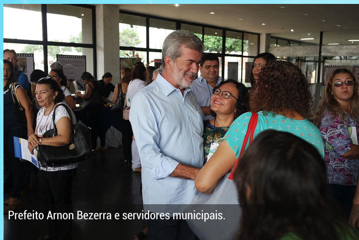
Prefeito Arnon Bezerra e servidores municipais.