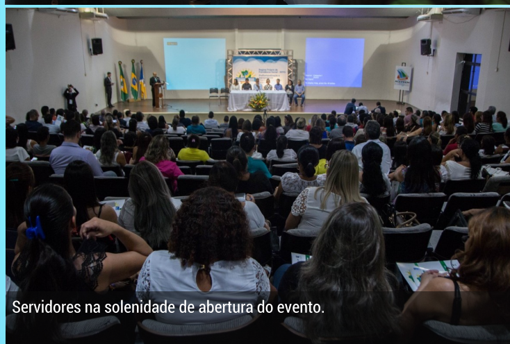
Servidores na solenidade de abertura do evento.