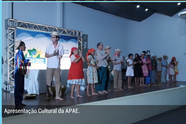
Apresentação Cultural da APAE.